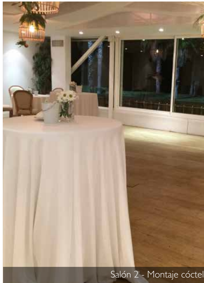
Salón 2 - Montaje cóctel