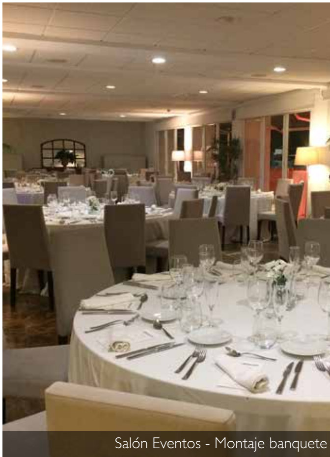
Salón Eventos - Montaje banquete

Disponemos de 3 salones para eventos con diferentes capacidades