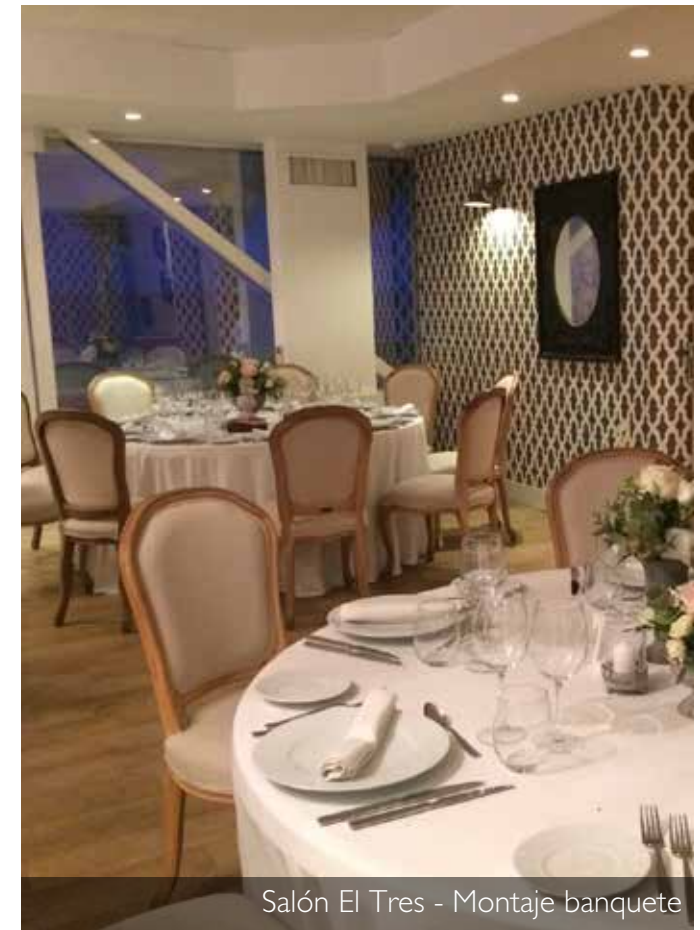
Salón El Tres - Montaje banquete